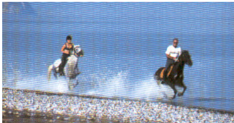
Εικ 15.4β...και σε πλήρη καλπασμό