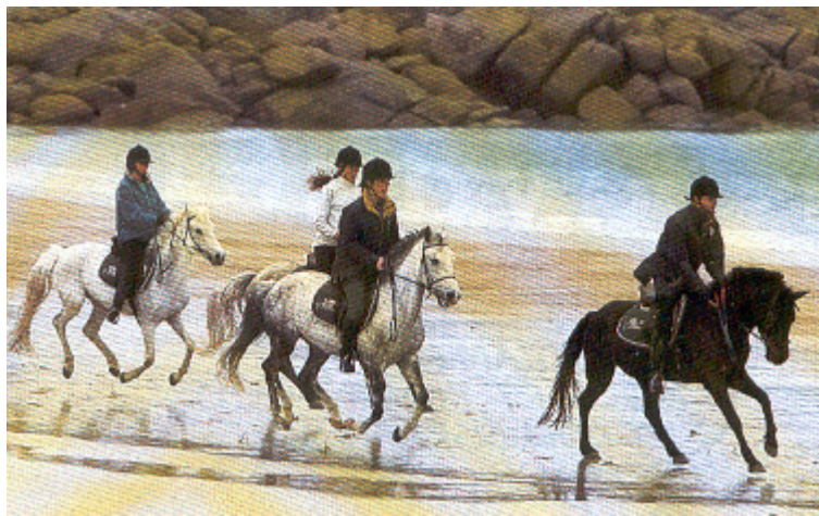
Εικ 15.4α Είσοδος στη θάλασσα (αρχικά στα ρηχά)