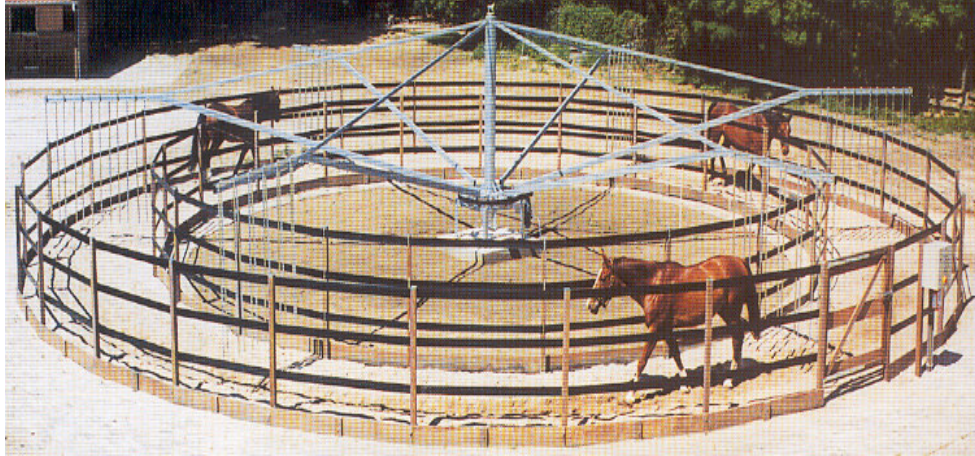
Εικ 15.3 'Περιπατητής' με διάδρομο και άλογα σε δεξιά βάδιση